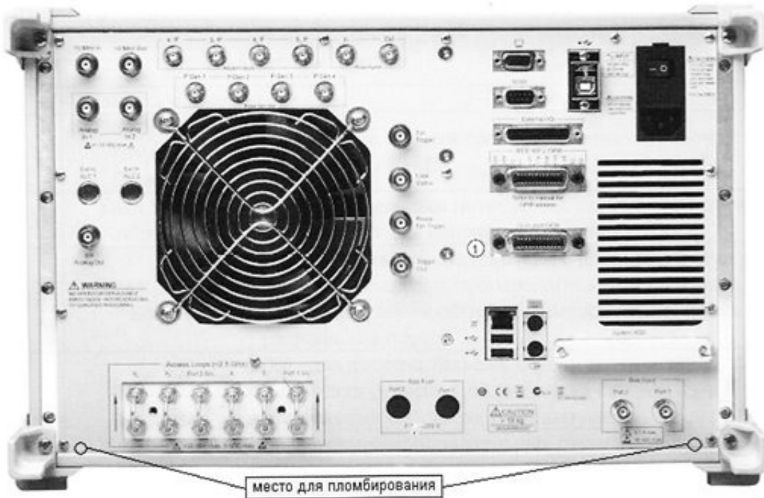
Рисунок 2 – Задняя панель анализатора и места для пломбирования.

На рисунке 3 представлен внешний вид анализатора с блоком расширения портов.