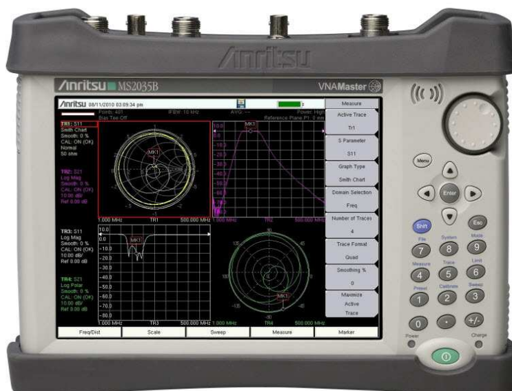
Фотография 1. Лицевая панель MS2024B, MS2025B, MS2034B, MS2035B