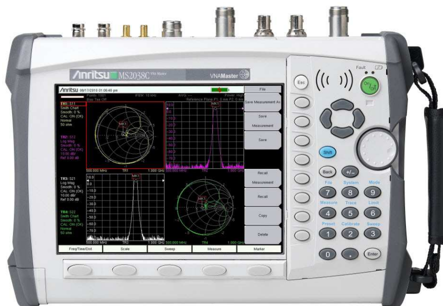
Фотография 2. Лицевая панель MS2026C, MS2028C, MS2036C, MS2038C